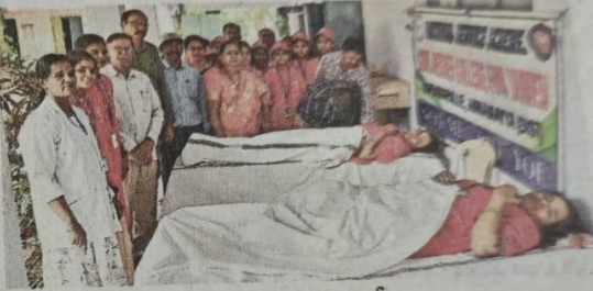
రక్తదానం చేస్తున్న ప్రభుత్వ మహిళా డిగ్రీ కళాశాల విద్యార్థినులు

మదనపల్లె విద్య, న్యూస్టుడే : రక్తం చూస్తూనే చాలా మంది అమ్మాయిలు కళ్ళు తిరిగి పడిపోతుంటారు. అయితే అందుకు భిన్నం ఈ అమ్మాయిలు. భైర్యంగా ముందుకొచ్చి రక్తదానం చేస్తున్నారు. అవసరార్థులకు రక్తమిచ్చి వారి ప్రాణాలు నిలుపుతున్నారు. చదువుతో పాటు సేవా కార్యక్రమాల్లో పాల్గొంటూ అందరికీ ఆదర్శంగా నిలుస్తున్నారు మదనపల్లె ప్రభుత్వ మహిళా డిగ్రీ కళాశాల విద్యార్థినులు. ఇటీవల ఆ కళాశాలలో నిర్వహించిన రక్తదాన శిబిరంలో రక్తమిచ్చి తోటి విద్యార్థులకు స్ఫూర్తిగా నిలిచారు.