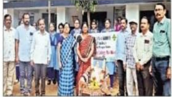
పాట్టి శ్రీరాములు చిత్రపటం వద్ద నివాళులు అర్పిస్తున్న అధ్యాపకులు